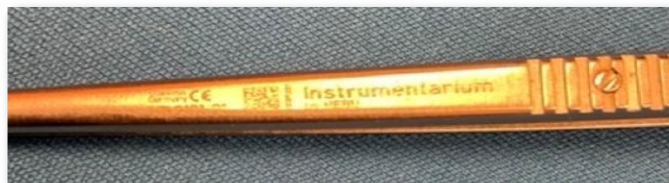
Code à barre (Data Matrix) sur pince

-À Saint-Étienne, le couplage RFID–DataMatrix a permis d'améliorer la gestion et la traçabilité de plus de 64 000 instruments [5].