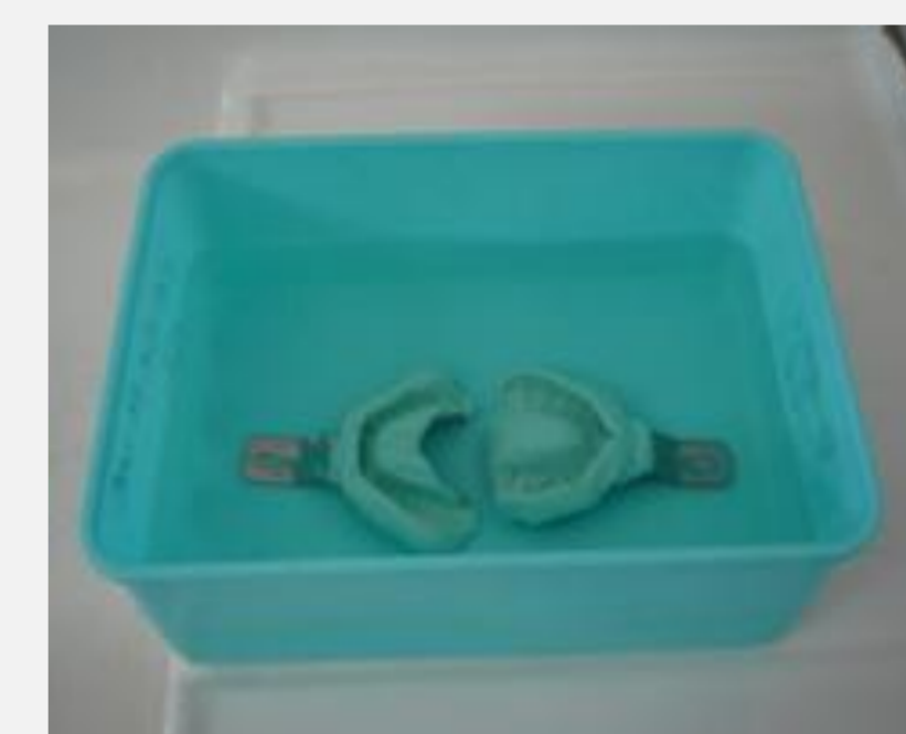
Immersion de l'empreinte pendant quelques secondes dans une solution d'hypochlorite de sodium à 0,5%.