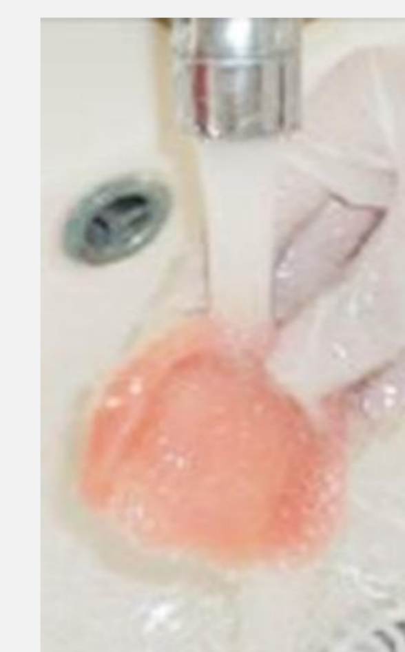
Rinçage de la prothèse à l'eau courante : élimination partielle des germes.