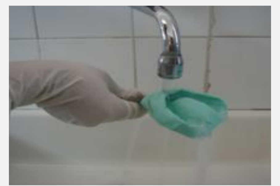
Rinçage de l'empreinte sous l'eau courante afin de la nettoyer.