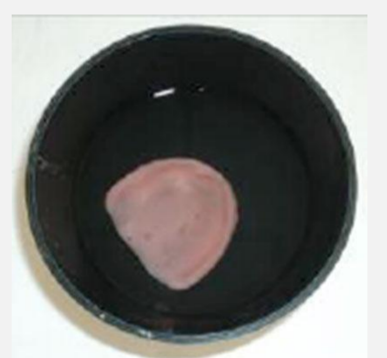
Immersion de la prothèse dans l'hypochlorite de sodium à 5,25% pendant 5 minutes.