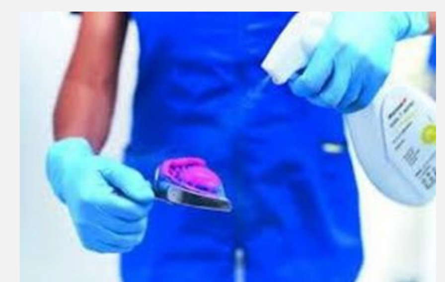
Pulvérisation de l'empreinte avec de l'hypochlorite de sodium.