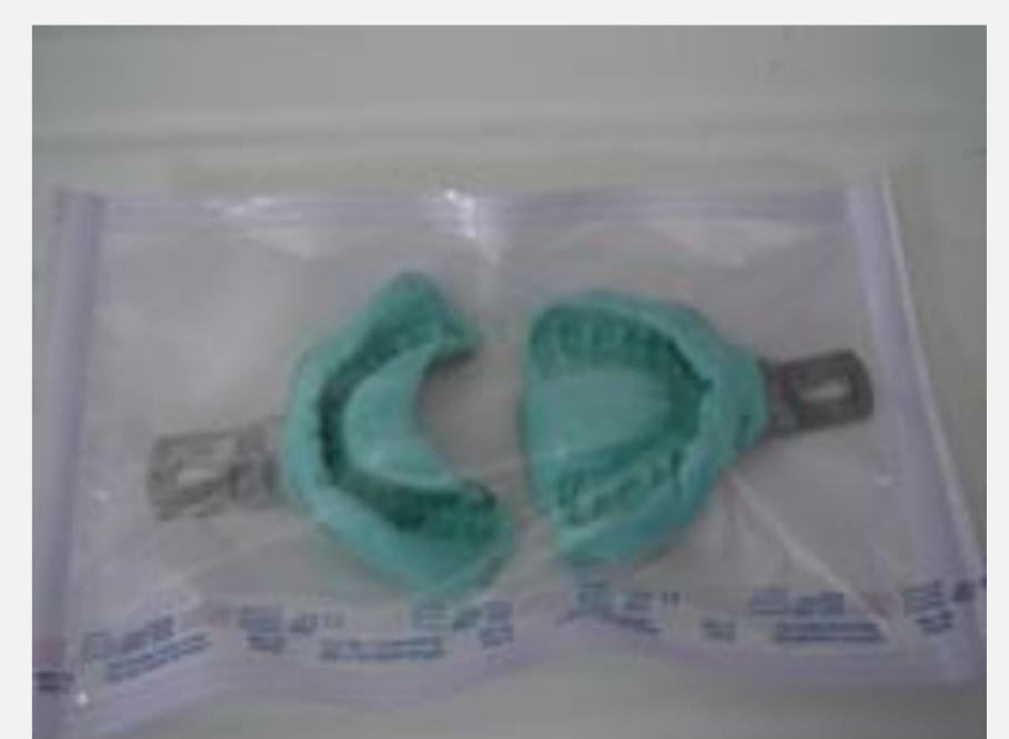
Conservation de l'empreinte dans un sachet plastique fermé.